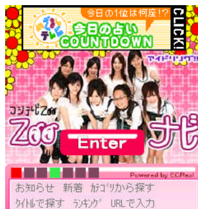
<「アイドルリング!!!」バージョン>