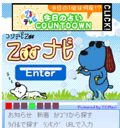
<「ラフくん」バージョン>